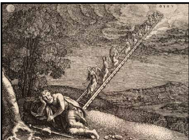
Aartsvader Jakob droomt over een ladder naar de hemel

In het Oude Testament lezen we over de droom van aartsvader Jakob waarin hij engelen via een ladder ziet opklimmen naar, en neerdalen van, de hemel 1 . Deze engelen symboliseren de ontwaakte kundalini-energie die door de wervelkolom (ladder) van de slapende Jakob stroomt. God spreekt tot hem in de droom en doet hem beloftes van bescherming en nageslacht. Bij het wakker worden is hij diep onder de indruk, en Jakob beseft dat hij nu zijn weg zal gaan met God. 2