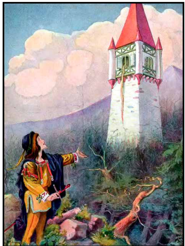
Het lange haar van Rapunzel hangt uit het raam van de toren waarin zij opgesloten zit

De ontwaakte kundalini-energie wordt in de beeldtaal ook wel gesymboliseerd door lange haren. Rapunzel laat, in het gelijknamige sprookje, opgetekend door de gebroeders Grimm, haar enorm lange haren hangen uit het raam van de toren (wervelkolom) waarin zij is opgesloten door een heks (symbool voor de materie). Een prins klimt via de haren omhoog en het uiteindelijke huwelijk van het verliefde stel is een metafoor voor het innerlijke heilige huwelijk: de versmelting van de mannelijke en vrouwelijke energieën; een onderdeel van het proces van spiritueel ontwaken. 3