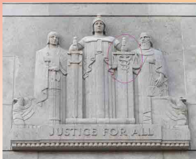
The John Adams Courthouse, bouwjaar 1893, Boston, Massachusetts.

(WIJSHEID 7:8, WILLIBRORDVERTALING 1975)