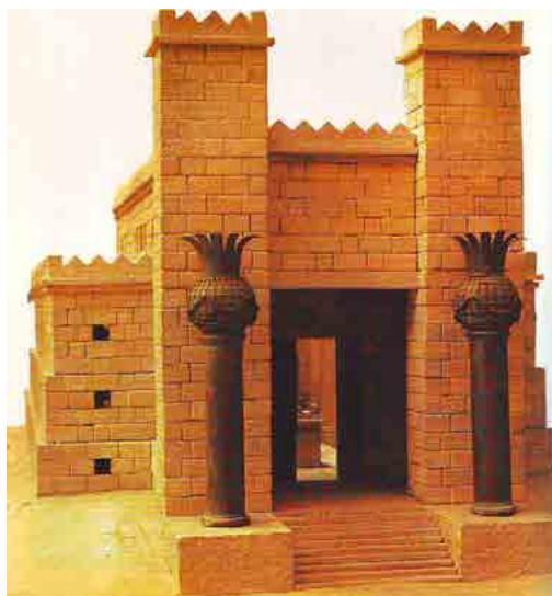
Een model van de tempel van Salomo

Aan het handvat van haar zwaard zitten drie symbolen voor goud (een cirkel met een punt in het midden): een verwijzing naar de goddelijke energie waar dit zwaard voor staat. Het doek tussen de pilaren is - net als bij de kaart van de Hogepriesteres - de sluier van Isis: de sluier waarachter Isis/Sophia de grotere werkelijkheid verborgen houdt.