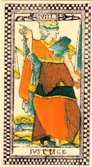
De Tarot van Paris (17e eeuw)

De Tarot van Parijs (links) gooit het over een iets andere boeg, waardoor nog duidelijker wordt waar de kaart Gerechtigheid voor staat. De figuur heeft een hoofd met een mannelijk en een vrouwelijk gezicht.