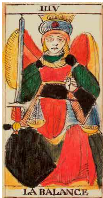
Marseille versie Payen-Webb (18e eeuw)

De gevlochten halsketting verwijst naar de twee polaire energiebanen die bij een kundalini-ontwaken versmelten tot één. De gekrulde haarlokken van de vrouw staan voor hetzelfde. Op beide kaarten raakt één haarlok de halsketting, om aan te geven dat ze voor hetzelfde staan.