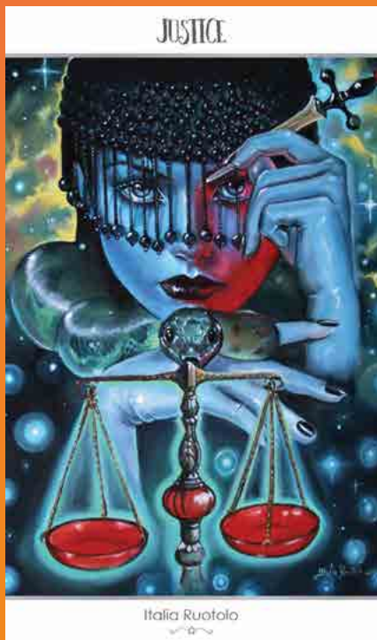
78 TAROT ASTRAL (2017) www.78tarot.cards

Een prachtige kaart met de kundalini-slang die de weegschaal vasthoudt. De punt van het zwaard staat tussen de ogen, gericht op de pijnappelklier.