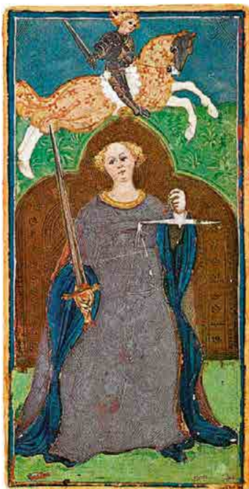
De Visconti-Sforza Tarot (15e eeuw)

De schalen van de weegschaal op de Visconti di Modrone-kaart hebben verschillende kleuren: goud en zilver. Dit is een verwijzing naar de polaire energieën van zon (goud) en maan (zilver), die in balans zijn gebracht. De kleuren van de mantel van de vrouw symboliseren hetzelfde: rood staat voor de mannelijke energieën en blauw voor de vrouwelijke.