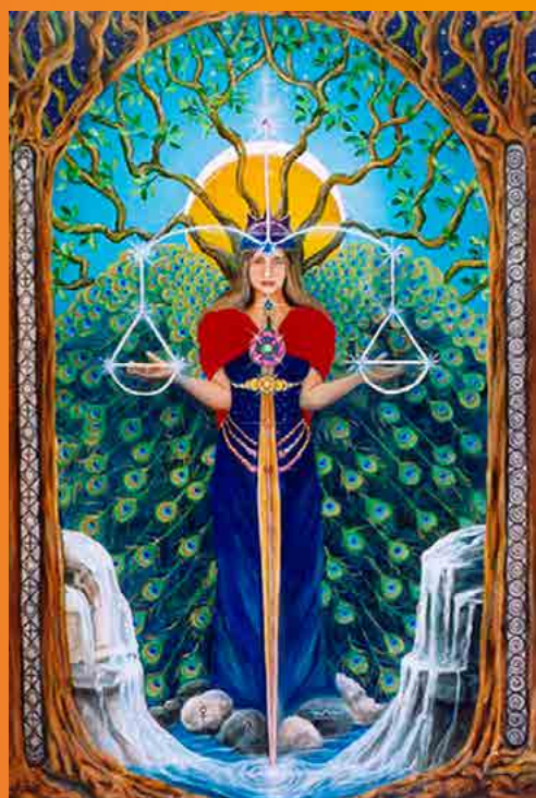
THE STAR TAROT (CATHY MCCLELLAND, 2017) www.cathymcclelland.com

Veel relevante kundalini-symbolen die op inventieve wijze zijn gecombineerd: drie bomen, stromend water, het samenvallen van zon en maan, pauwenveren, en het voorhoofd als centraal punt waar de polariteiten versmelten.