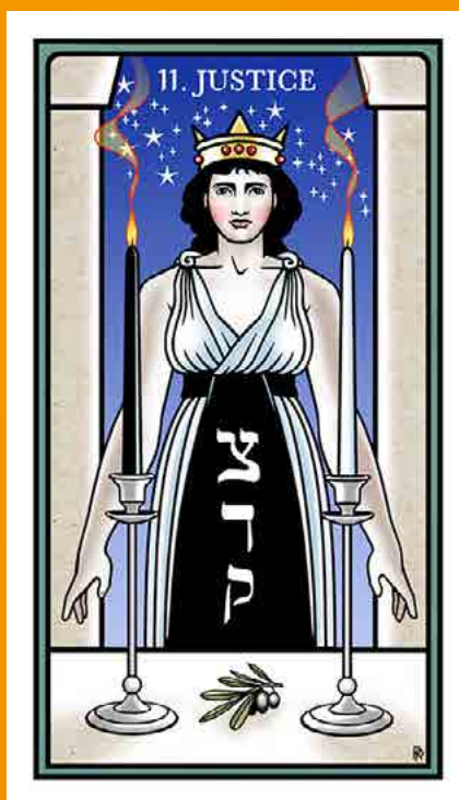
THE RAZIËL TAROT (ROBERT M. PLACE, 2016) www.robertm-placetarot.com

Veel relevante kundalini-symbolen die op inventieve wijze zijn gecombineerd: drie bomen, stromend water, het samenvallen van zon en maan, pauwenveren, en het voorhoofd als centraal punt waar de polariteiten versmelten.