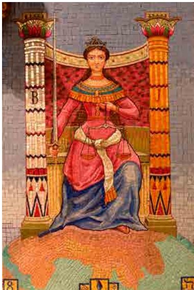
De mozaïek in Château des Avenièrès (1917)