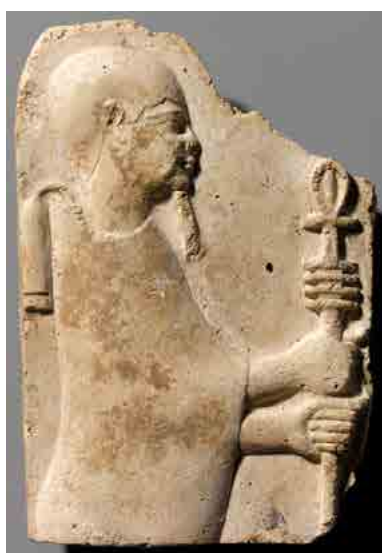
De Egyptische god Ptah met een Ankh op een Djed-pilaar (4 e -3 e eeuw v. Chr.)

De scepter van de RWS-Keizer zegt hetzelfde, met andere beelden. De RWS-scepter is een afgeleide van de Ankh , het Egyptische symbool dat staat voor eeuwig leven. Een Ankh is een gestileerde weergave van de wervelkolom met bovenaan de pijnappelklier, vergelijkbaar met de caduceus . De Ankh -scepter van de RWS-Keizer is bovenop een van de ramskoppen geplaatst. De boodschap hiervan is dat de Keizer de dierlijke energieën van de onderbuik omhoog geleid heeft, via de wervelkolom, naar de pijnappelklier.