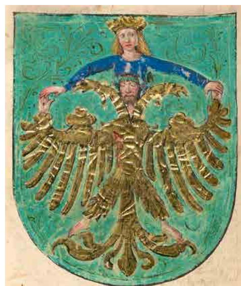
Illustratie uit: Buch der Heiligen Dreifaltigkeit (15 e eeuw)