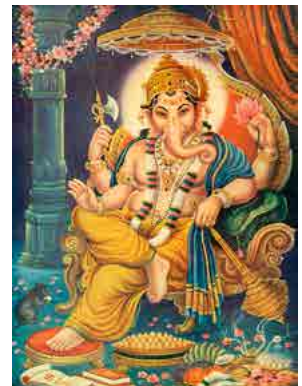
De god Ganesha

De twee vleugels bovenaan de caduceus staan voor een bewustzijnsverruiming. De staf zelf heeft dezelfde betekenis als de scepter in de hand van de Keizer: de wervelkolom met erin stromend de goddelijke kundalini. De twee slangen die langs de staf omhoog kronkelen, staan voor de dualiteit die tijdens het proces van ontwaken versmelt tot een eenheid. Op de kaart van de Keizer is dit aspect op subtiele wijze verwerkt in zijn benen. Op één Visconti-kaart zien we de Keizer afgebeeld met gekruiste benen (2=1) en op de andere kaart komt slechts één voet onder zijn gewaad uit. Het thema van de gekruiste benen zal worden overgenomen door de Tarot van Marseille, en door vele andere decks die hierna volgen.