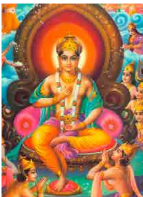
De Boeddha op jongere leeftijd

In het Hindoeïsme worden goden en heiligen afgebeeld met één voet op de grond om tot uitdrukking te brengen dat zij niet (langer) verbonden zijn met de dualiteit, maar geworteld zijn in de goddelijke eenheid.