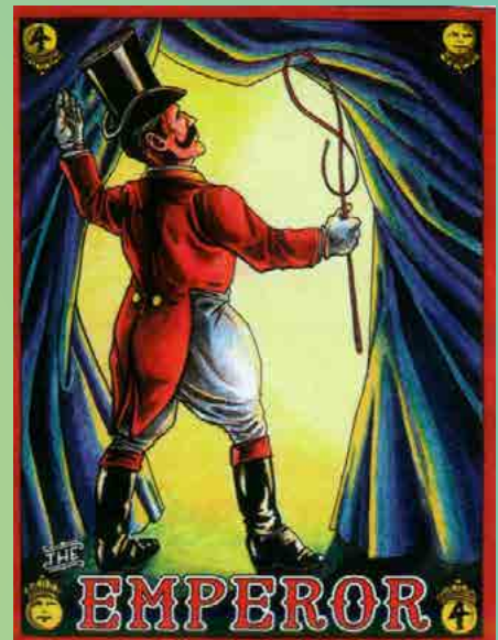
THE RAVEN'S PROPHECY TAROT (LEWELLYN, 2015)