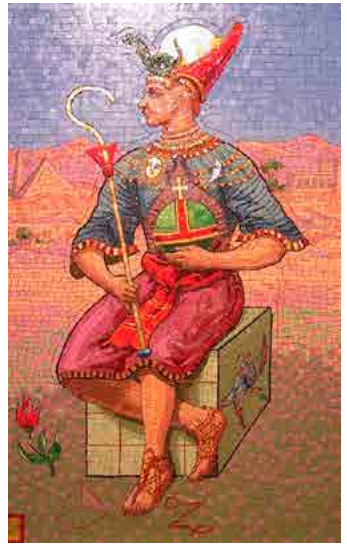
De Keizer in mozaïek van Château des Avenières (1917)

De Pschent (midden) is samengesteld uit twee kronen: links de godin Wadjet met de rode kroon van Beneden-Egypte en rechts de godin Nekhbet met de witte kroon van Boven-Egypte.