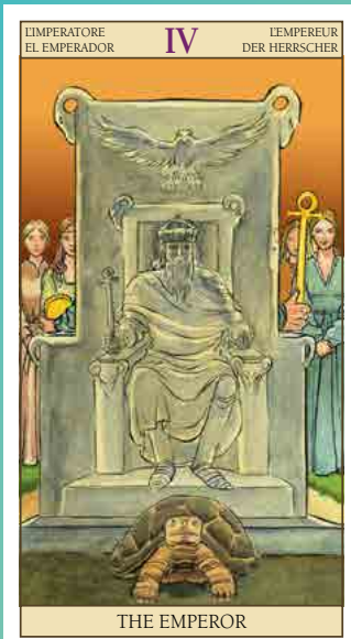
TAROT OF THE NEW VISION (LO SCARABEO, 2003)

Dit deck brengt in beeld wat je ziet als je de Rider-Waite kaarten 180 graden draait. De schildpad voor de troon van de Keizer staat voor het geduld en het doorzettingsvermogen die nodig zijn om het spirituele keizerschap te bereiken. Een schildpad die zijn kop en poten naar binnen trekt, is tevens een bekende metafoor voor meditatie (het terugtrekken van de vijf zintuigen uit de buitenwereld). Lo Scarabeo voegt hier zelf nog aan toe: 'Een schildpad draagt de last van zijn eigen huis. Dit brengt een verantwoordelijkheid met zich mee.'