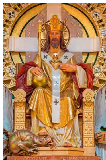
Jezus als 'Koning van het Heelal', met de duivel, in de vorm van een draak, onder zijn voeten. Beeld en betekenis zijn vergelijkbaar met het 'spirituele keizerschap' van tarotkaart nummer 4. Of, in de woorden van Jezus: "Mijn koningschap is niet van deze wereld..." (Joh. 18:36)