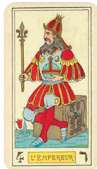
Oswald Wirth Keizer (1889)

Op de bovenkant van zijn scepter (symbool voor wervelkolom) is een fleur-de-lys , of 'Franse lelie', geplaatst; een esoterisch symbool voor de pijnappelklier. >