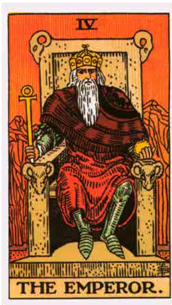
Rider-Waite-Smith Keizer (1909)

De RWS-Keizer is gekleed in rood. Dit is, zoals we zagen bij de bespreking van de voorgaande kaart, de Keizerin, een verwijzing naar het alchemistische koningspaar (rode koning en witte koningin) dat versmelt tijdens het Magnum Opus . De bergen op de achtergrond symboliseren een verruimd bewustzijn.