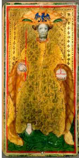
Twee versies van de Visconti Keizer (15 e eeuw)