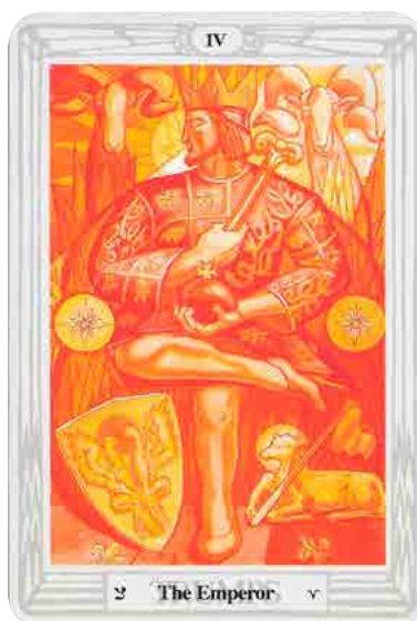
De Thoth-Keizer (1969)

Aleister Crowley heeft niet veel christelijke thema's verwerkt in zijn deck. Rechtsonder op zijn Keizer-kaart zien we één van de uitzonderingen: het zegevierende Lam uit het boek Openbaring, met de visioenen van Johannes. Uit het volgende citaat kunnen we opmaken dat het Bijbelse Lam op deze kaart de tegenhanger is van de seksuele energie waar de ram voor staat: >