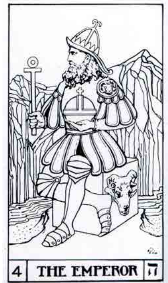
Builders of the Adytum Tarot (circa 1950)