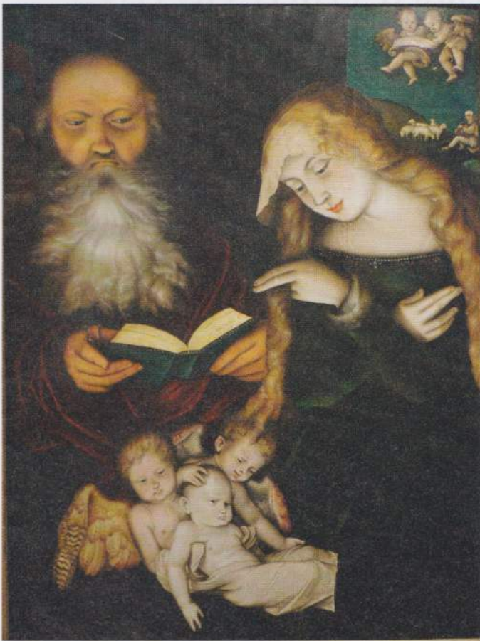
Afbeelding: Hans Baldung, 1539, Staatliche Kunsthalle, Karlsruhe.