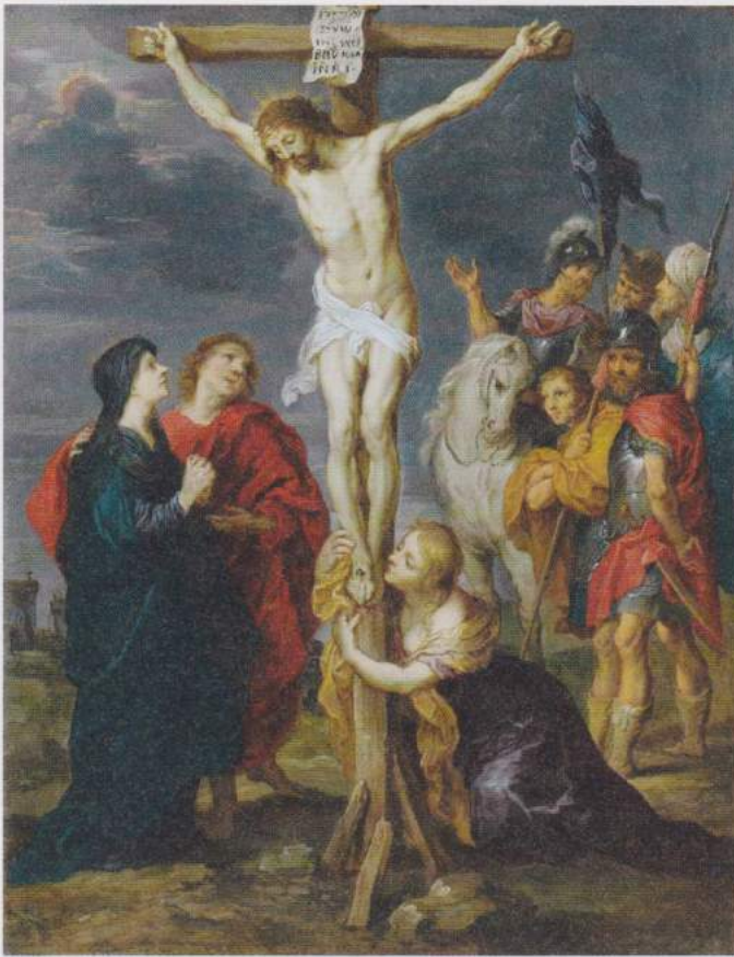
Afbeelding: Paul Rubens (studio van), eerste helft 17 e eeuw, privécollectie.

maken en deze op een paal te zetten. Wie naar de koperen slang kijkt nadat hij is gebeten, blijft in leven (Numeri 21:4-9). Het Hebreeuws dat is vertaald met gifslangen - nachash saraph - betekent letterlijk brandende (vurige) slangen. Deze slangen van vuur verbeelden de kundalini of Heilige Geest. Het verhaal laat zien wat de gevolgen zijn als de goddelijke energie in het bekken wordt aangewend voor de verlangens van de (onder)buik; voor zintuiglijke bevrediging en oppervlakkige pleziertjes. Als 'de vurige slang', na het Peter ontwaken, niet omhoog wordt geleid, maar blijft hangen in het bekken en hier de buik 'in brand' zet ('branden van verlangen'), werkt deze als dodelijk gif voor de ziel. De mens sterft in spiritueel opzicht. Wordt de slang echter omhoog geleid door de wervelkolom ('op een paal gezet') dan blijft de mens 'leven'.