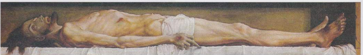
Hans Holbein de Jonge, 1521, Kunstmuseum Basel.

Jezus zei tot hen: Als jullie de twee tot één maken, en als jullie de binnenkant maken als de buitenkant, en de buitenkant als de binnenkant, en de bovenkant als de onderkant, en wanneer jullie het mannelijke en het vrouwelijke één maken, zodat het mannelijke niet langer mannelijk is en het vrouwelijke niet vrouwelijk. ...dan zullen jullie het Koninkrijk binnengaan. (Logion 22)