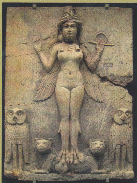
De Semitische godin Ishtar/Inanna, staande op twee leeuwen (reliëf uit de 19 e eeuw voor Chr.)