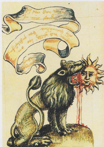
Een embleem uit de alchemie (16 e eeuw)

Ook in de Bijbel lezen we over iemand die met zijn blote handen een leeuw verslaat: de geweldenaar Samson. Later ontdekt hij in het karkas van de leeuw een bijennest met honing. Dit is een verwijzing naar de 'drank der onsterfelijkheid' van de goden ( amrita in het hindoeïsme, mede in de Noorse traditie, ambrozie bij de Oude Grieken), die volgens de mythes naar honing smaakt. Het bijennest symboliseert de verwezenlijking van het goddelijke door Samson; de beloning die hij krijgt voor het overwinnen van zijn emoties. Weer een andere variatie op dit thema is de profeet Daniël, uit het Oude Testament, die wonderbaarlijk genoeg ongedeerd blijft na een nacht in een leeuwenkuil. Deze man van God wordt niet langer beheerst door zijn emoties en driften, is de boodschap van de Bijbelschrijvers.