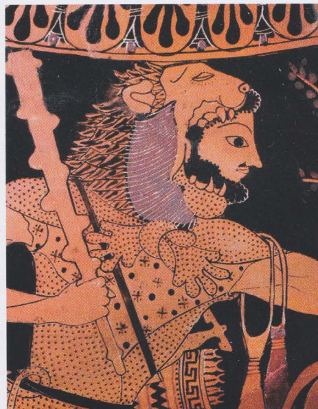
Herakles met leeuwenhuid, op een oude Griekse amfora (vaas).