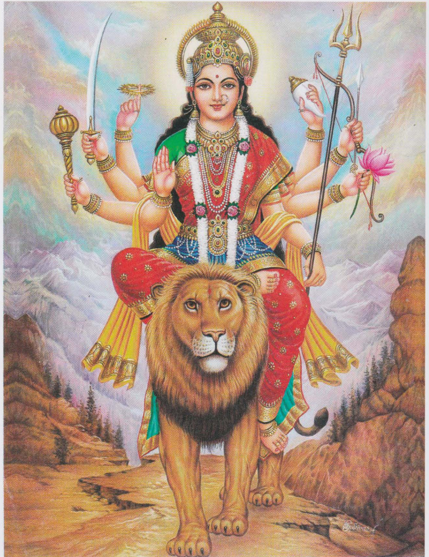
De hindoegodin Durga met haar rijdier

‘Beelden zijn een krachtig instrument om het onzichtbare begrijpelijk te maken’