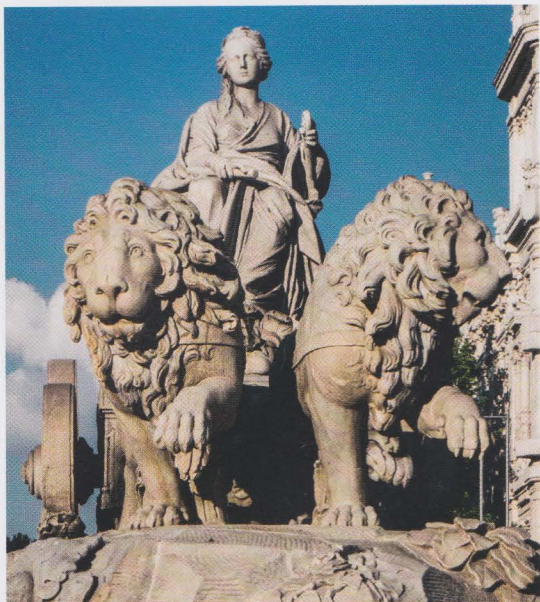
De godin Rhea/Cybele (fontein in Madrid)

Een variatie op het thema van de leeuw als rijdier, is het doden van een leeuw met bijzondere gevolgen. De Griekse halfgod Herakles moet in opdracht van koning Eurystheus twaalf onmenselijk zware 'werken' (opdrachten) uitvoeren; een metafoor voor de uitdagingen waarvoor de mens staat die het goddelijke wil verwezenlijken. De eerste opdracht is het doden van de legendarische leeuw van Nemea. De huid van de leeuw blijkt ondoordringbaar, wapens kunnen hem niet deren. Herakles moet noodgedwongen het dier met zijn blote handen wurgen (je moet eigenhandig je emoties te lijf, niets of niemand kan je daarbij helpen). Na zijn overwinning vilt Herakles de leeuw en draagt hij de huid als mantel, met het leeuwenhoofd als kap: de krachten (energieën) van de leeuw (zijn gevoelsleven) staan nu ten dienste van Herakles.