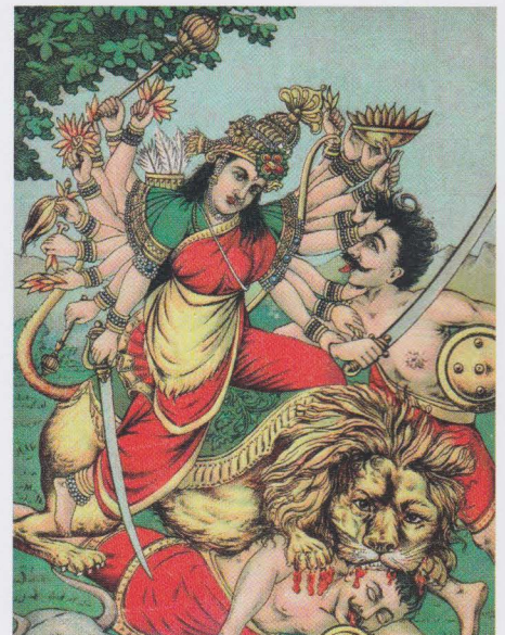
De godin Durga in gevecht met demonen

De godin Durga heeft als rijdier een leeuw. Dat dit staat voor meesterschap over haar emoties, zo mogen we mede afleiden uit haar serene uiterlijk. Het is een vechtlustige godin die met diverse wapens wordt afgebeeld, maar ze blijft innerlijk onbewogen onder het strijdgeweld. Op de illustratie zien we haar zittend op haar leeuw demonen bevechten: ze gebruikt de oerkrachten van haar emoties voor een spirituele opruiming. Als je je emoties meester bent, heb je ook de kracht om je innerlijke demonen te bevechten, zegt dit beeld.