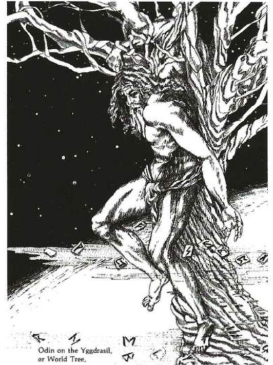
Odin opgehangen aan Yggdrasil

kundalini kan echter ook actief worden door drugsgebruik en kan dan veel negatieve bijwerkingen hebben, omdat de energie ontwaakt in een 'vervuilde omgeving'. Hetzelfde kan gebeuren bij een fysiek of emotioneel trauma. Bij bijvoorbeeld een bijna-doodervaring, zware bevalling of ernstige depressie kan de energie fungeren als een noodaggregaat en actief worden om het leven van deze mens te redden. Dit kan echter naderhand tot complicaties leiden, omdat het proces vaak onomkeerbaar is. Als de kundalini-geest uit de fles is, gaat deze er over het algemeen niet meer terug in.