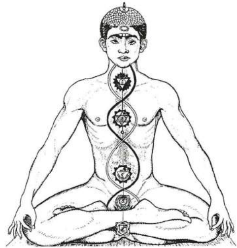
Een schematische voorstelling van het kundalini-proces

'Alle avonturen van goden, godinnen en mythische dieren verwijzen naar onze mogelijkheid tot innerlijke transformatie'