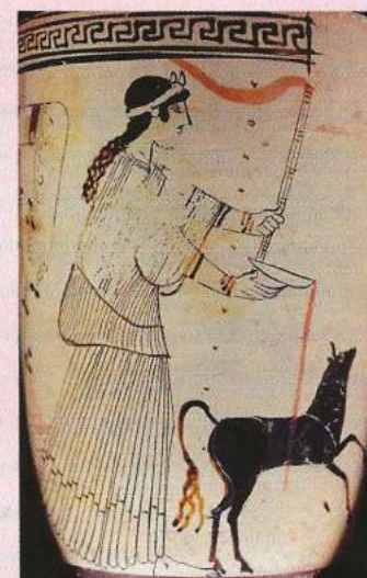
De godin Artemis