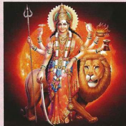
De godin Durga

Van de vele Griekse goden die aspecten vertegenwoordigen van het kundalini-proces, licht ik er voor deze rondreis drie godinnen uit: Hera, Iris en Artemis. Hoewel moedergodin Hera getrouwd is met Zeus en een aantal kinderen heeft, wordt ze toch vereerd als de eeuwige maagd. Dit verwijst naar de opdracht van 'maagdelijkheid' (celibaat) van de aspirant. De oerkrachten in het bekken laten zich alleen naar de kruin leiden als