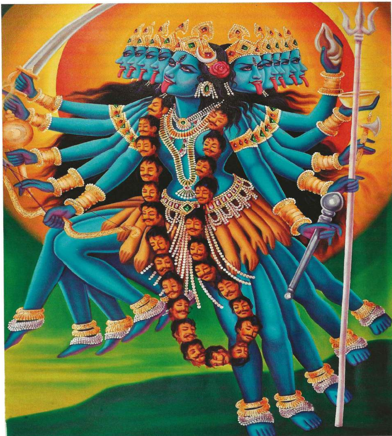
De godin Kali

kracht van de kundalini. Kali vernietigt alles wat tussen de mens en God in staat. Zij wordt traditioneel afgebeeld met een ketting om haar hals van bloederige, afgehakte hoofden. Trofeeën van alle ego's die zij al heeft vernietigd met de uitbundige en nietsontziende bewegingen van haar armen en benen. Zij is populair bij de hindoes, ondanks haar beangstigende uitstraling en bloedige attributen, omdat haar intenties voortkomen uit moederliefde. Zij verlost haar kinderen van hun gehechtheid aan het ego en het lichaam en vernietigt Maya (de sluier van illusies).